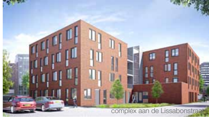
complex aan de Lissabonstraat

Lefier bouwt mee aan een leefbare stad voor jongeren. Met meerdere nieuwbouwprojecten komen wij tegemoet aan de vraag naar jongereenheden in en nabij het centrum van de stad. De komende jaren zal Lefier 1500 nieuwe wooneenheden voor jongeren realiseren.