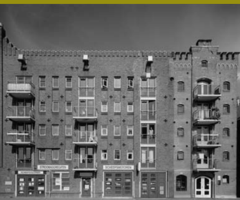
Voormalig pakhuis aan de Oosterhaven biedt nu onderdak aan studenten.

Deel 2: Woningbouw in de jaren '60, '70 en '80.