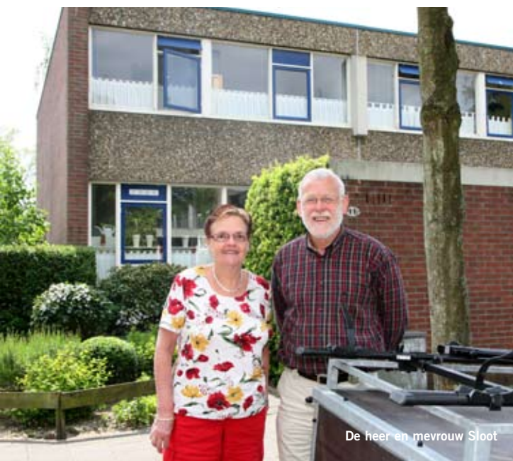
De heer en mevrouw Sloot

hun huis onlangs verrast door een ree. De wijk is in de afgelopen jaren groener geworden.