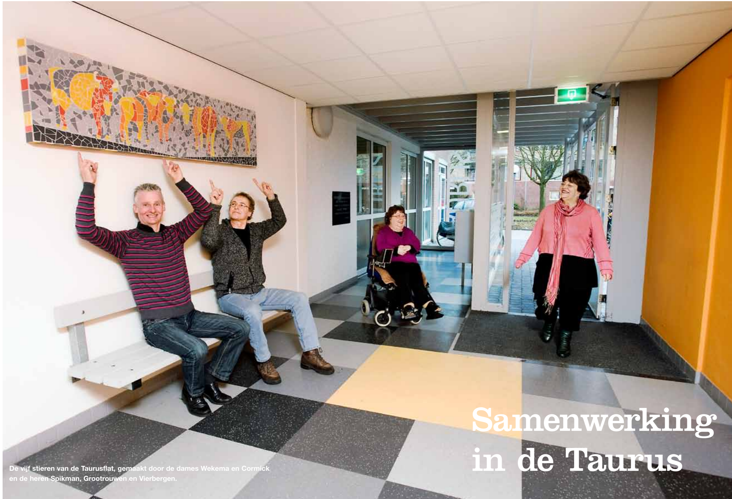
De vijf stieren van de Taurusflat, gemaakt door de dames Wekema en Cormick en de heren Spikman, Grootrouwen en Vierbergen.